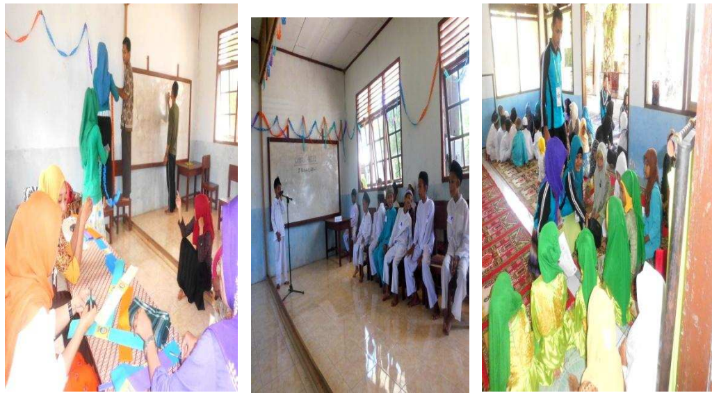
Gambar 1.3 Kegiatan Perlombaan Keagamaan