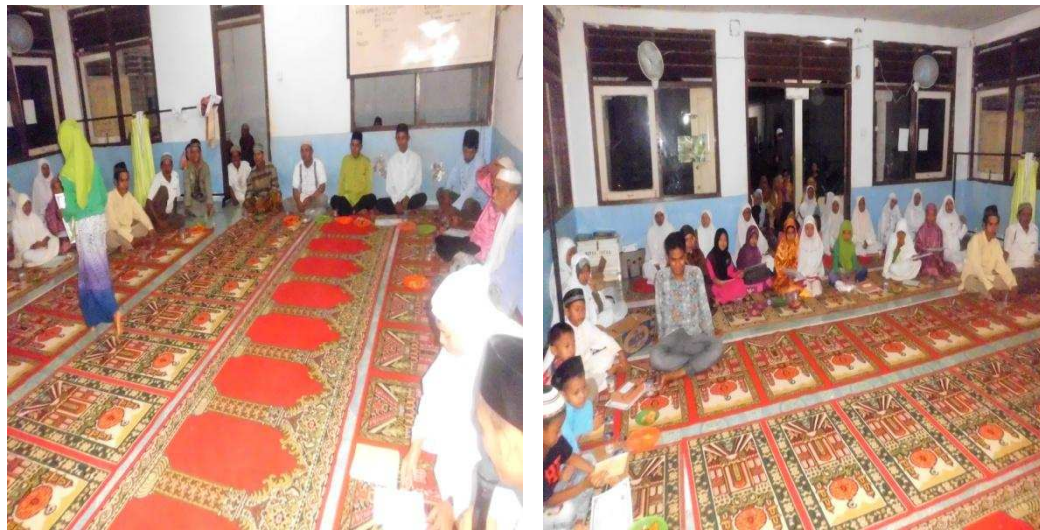
Gambar 1.6 Kegiatan Perlombaan Memperingati Nuzulul Qur'an