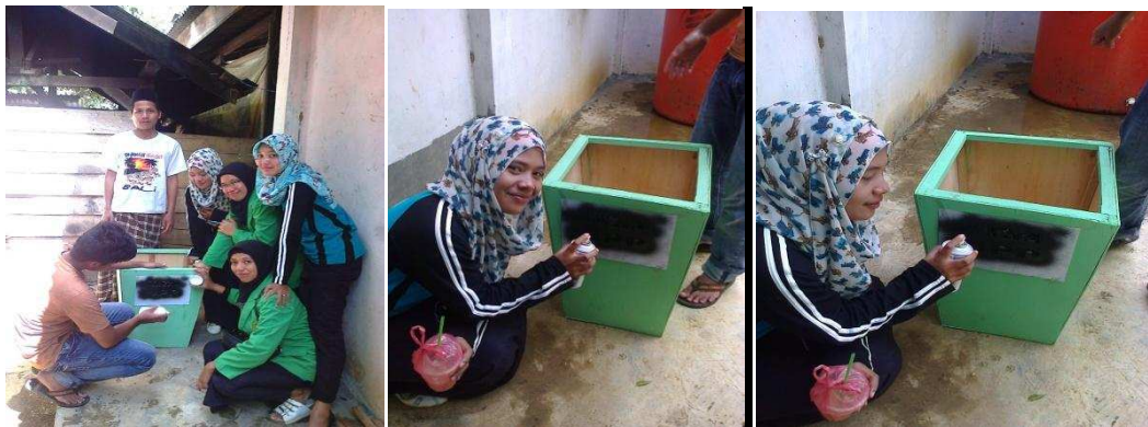
Gambar 1.1 pembuatan Tempat sampah di Posko KKN

Mahasiswa menindak lanjuti program tersebut dengan berkunjung ke kantor desa untuk membicarakan pembuatan Tempat sampah yang telah mahasiswa rencanakan. Hal ini ditanggapi positif oleh perangkat desa dan masyarakat. Program pembuatan Tempat sampah yang mahasiswa lakukan bertujuan untuk meningkatkan kebersihan dan keindahan di sekitar desa Lubuk Kerapat. Dengan adanya Tempat sampah yang telah dibuat oleh mahasiswa, diharapkan agar warga dapat membuang sampah pada Tempat sampah yang telah ada. Dengan pembuatan Tempat sampah ini, diharapkan dapat meningkatkan kebersihan dan keindahan di desa Lubuk Kerapat, sehingga lingkungan menjadi bersih dan sehat.