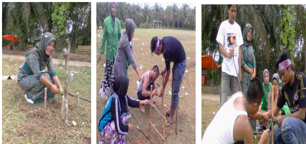
Gambar 1.4 Kegiatan Penghijauan Lingkungan

Dalam rangka kegiatan Kuliah Kerja Nyata (KKN) Universitas Pasir Pengaraian Angkatan Ke- III maka mahasiswa menemukan beberapa masalah setelah melakukan sosialisasi dan juga telah mensurvey tidak adanya pohon pelindung di sekitar Kantor – Kantor, Sekolah, Puskesmas, Dan Lapangan daerah setempat. Oleh karena itu kami memiliki ide untuk melaksanakan kegiatan penghijauan dengan bibit buah dan pohon kayu pelindung yang kami dapatkan dengan cara membuat proposal bantuan ke Dinas Pertanian Dan Holtikultura.