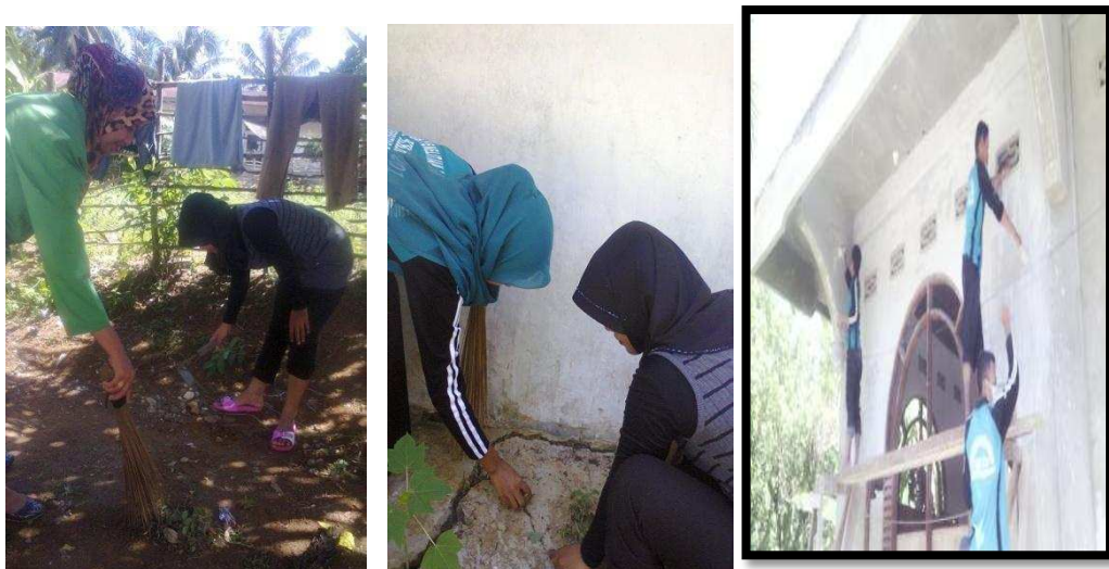
Gambar 1.5 Pemugaran Tempat Ibadah

Sebagai perwujudan prioritas dari mahasiswa KKN tentang pemugaran tempat ibadah ini, dimulai mendiskusikan program ini dengan pengurus mesjid. Hal ini disambut dengan baik oleh pengurus mesjid karena sebelumnya sudah direncanakan untuk mengecat pagar tetapi belum terlaksana.