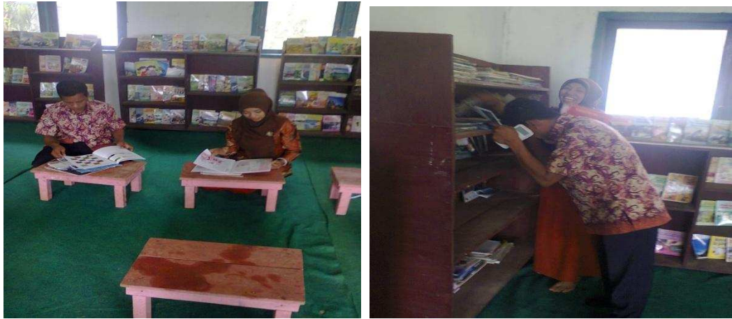
Gambar 1.7 Pembinaan Perpustakaan Sekolah