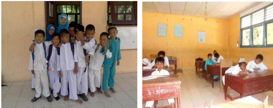
Gambar 1.2 Pelaksanaan pengajaran Tambahan

Pelaksanaannya dimulai dengan melakukan kunjungan ke sekolah dan melaksanakan pengajaran tambahan di sekolah tersebut.